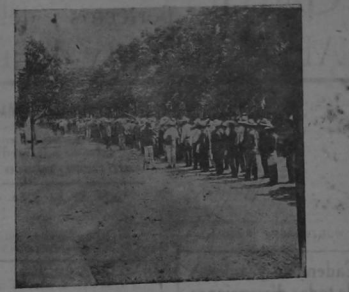
Maaya.—Revistando las tropas antes de partir para el teatro de la guerra

Propone que el privilegio se otorgue á las máquinas que destribren 100,000 hojas y que cualquiera establezcan las que destribren menos.